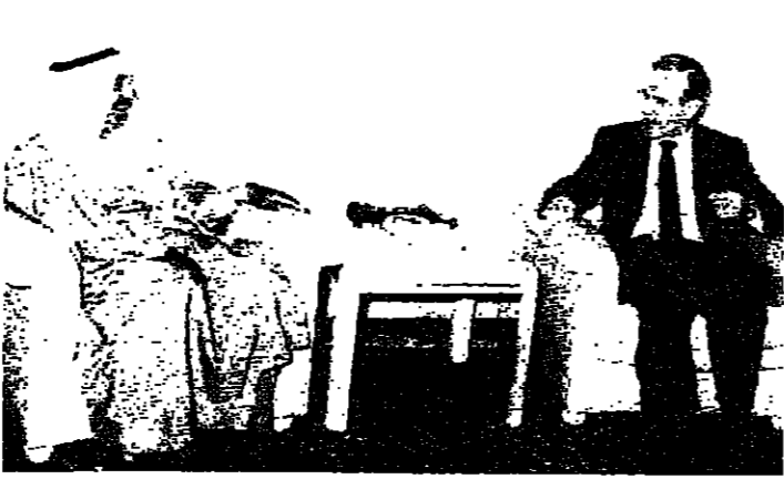
الأسد خلال لقائه مع صباح الاحمد